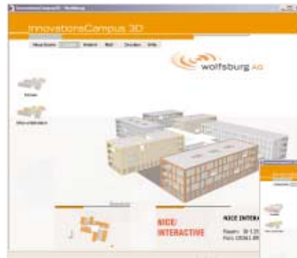
InnovationsCampus 3D - Wolfsburg

I am a dummy copy. And I've been a dummy copy since my birth. It took me a long time to realize what it means to be a dummy copy: you make no sense.