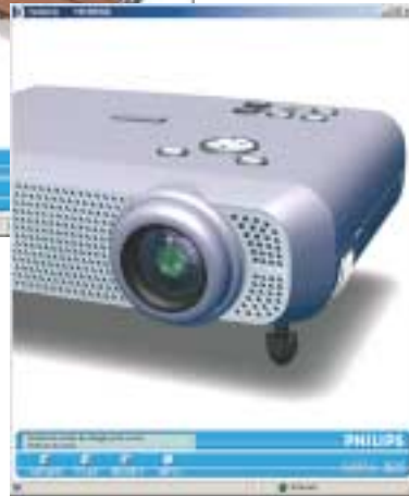
BEAMER/HAUS (MIRA 3D)