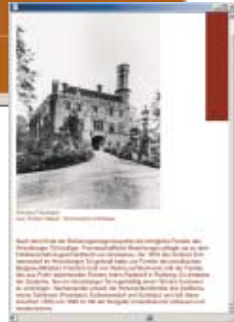
VIRTUELLES MUSEUM PREUSSEN