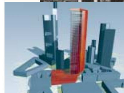
Hochhaus Max (Frankfurt)